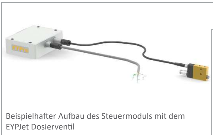
Beispielhafter Aufbau des Steuermoduls mit dem EYPJet Dosierventil